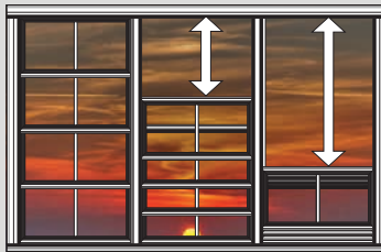
Système de fenêtre stéréo triple 8pi - 12pi